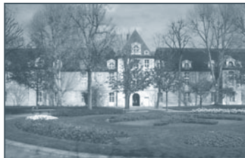
CHU Saint-Louis/quadrilatère historique