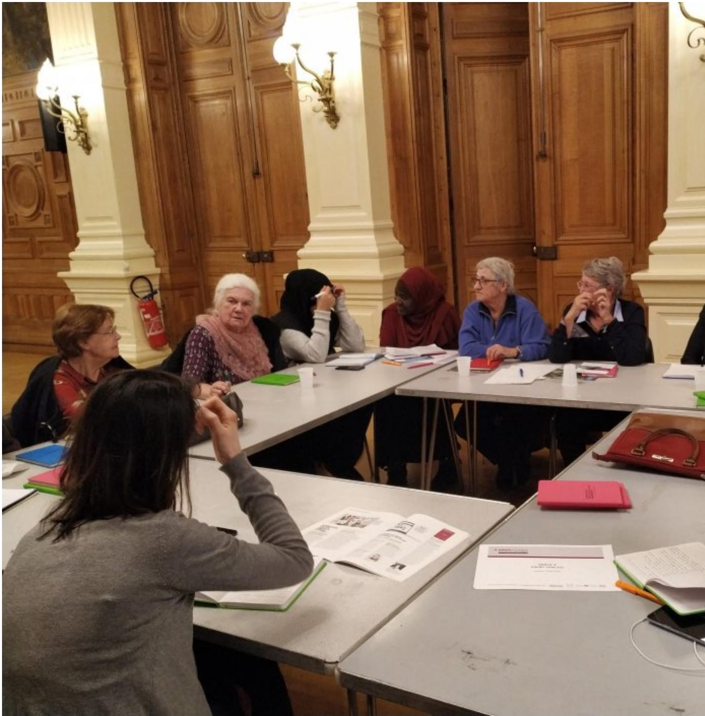
Le débat du 28 février 2019 en images