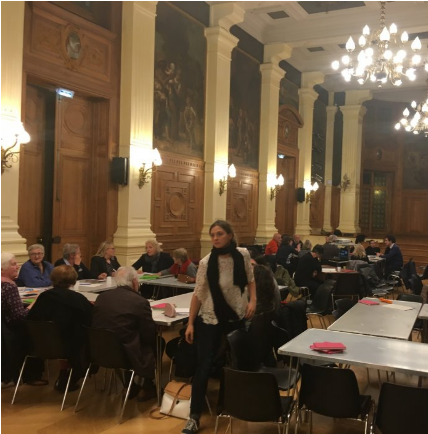
Le débat du 28 février 2019 en images