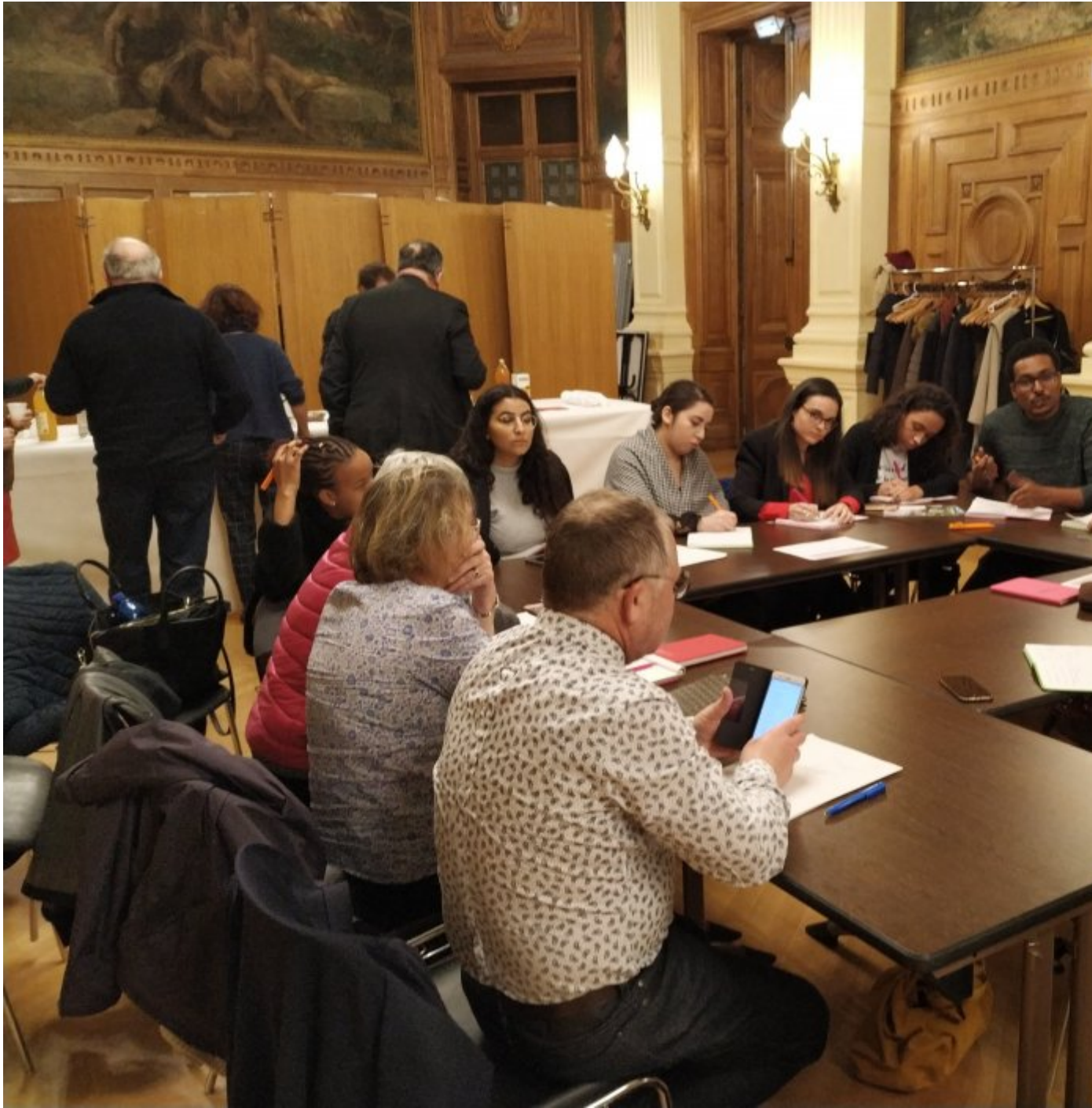
Le débat du 28 février 2019 en images