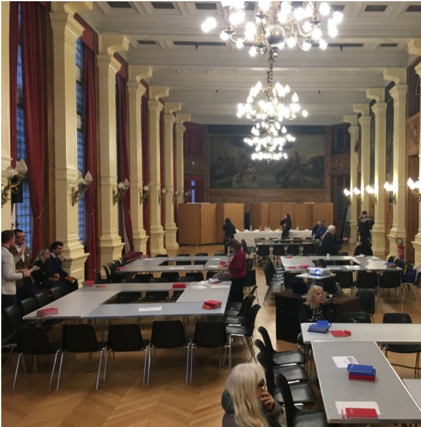
Le débat du 28 février 2019 en images