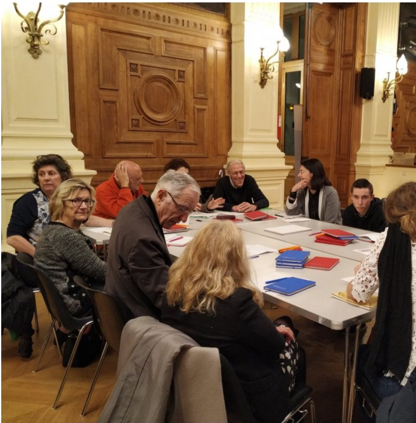
Le débat du 28 février 2019 en images